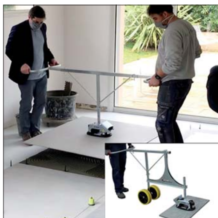
FXAH-120-GRABO-GREENLINE avec FXAH-120-DUO-Set, en bas à droite : en plus avec jeu de roues VPH-RS