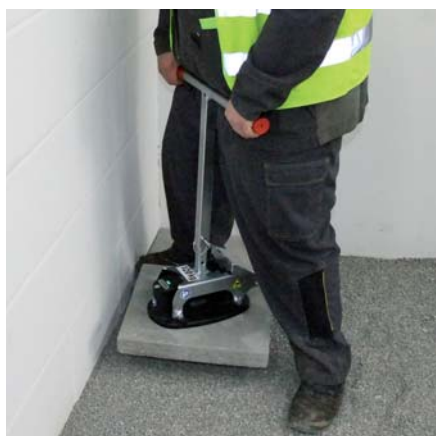
FXAH-120-GRABO-GREENLINE avec FXAH-120-SOLO-Set