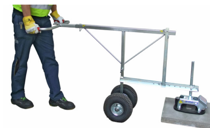
FXAH-120-GRABO-GREENLINE avec kit roues VPH-RS et FXAH-120-DUO

Posez des dalles encore plus facilement et commodément sur de grandes roues – rapide et efficace.